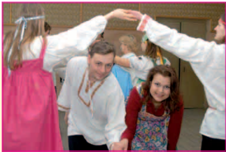
Академия народного праздника в Чебоксарах