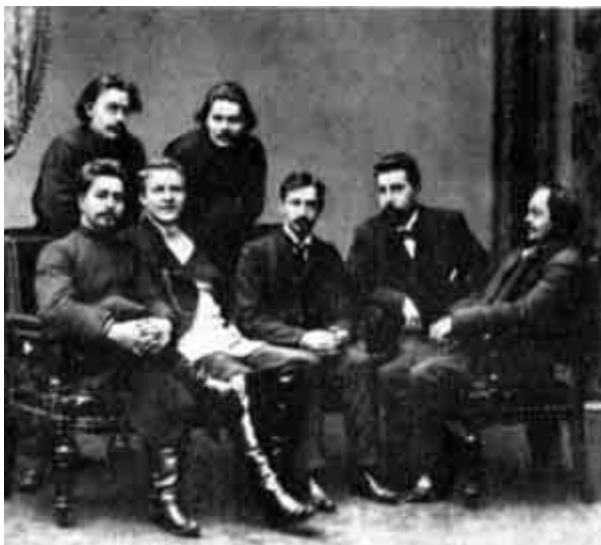
«Среда». Сидят — Л.Н. Андреев, Ф. И. Шаляпин, И. А. Бунин, Н. Д. Телешов, Е. Н. Чириков; стоят — С. Г. Скиталец, М. Горький.

Ночами не смыкал он век, Ловил минуты вдохновенья, Вздыхал: — Да, я не Человек! Я, извините, — Учреждение!»