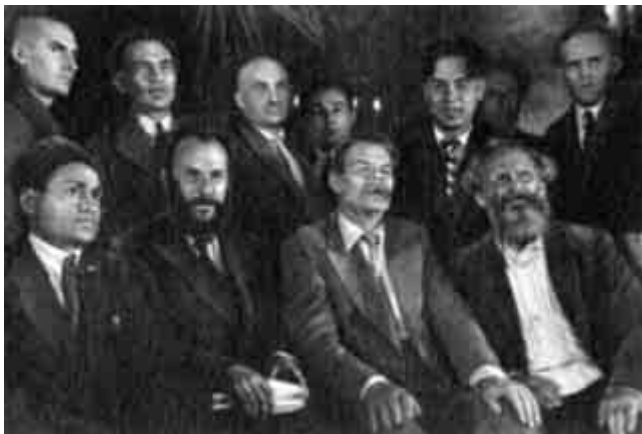
М. Горький среди сибирских писателей на Первом Всесоюзном съезде советских писателей.

Решенье принято: Создать — Союз писателей Советов.