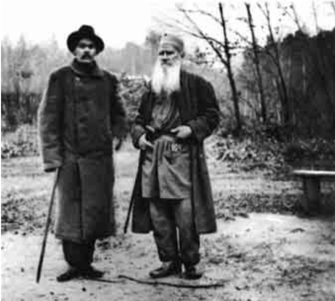
М. Горький и Л. Н. Толстой. 1900 г.