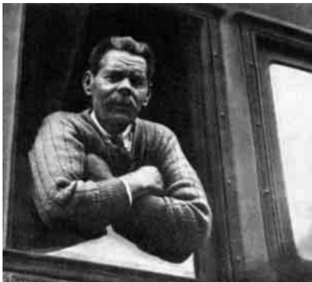
М. Горький на пути в СССР. 1928 г.