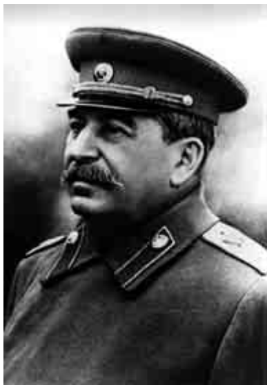
И. В. Сталин. 1941 г.