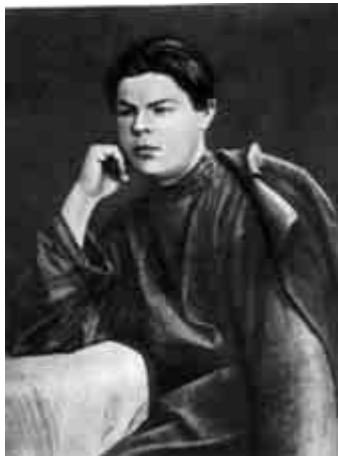
А. Пешков. 1887 г.

Умывался белым снегом, Птицеловом ловким стал.