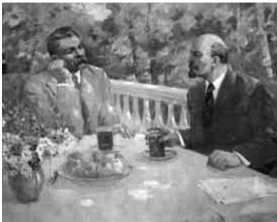
М. Горький и В. Ленин

Ярче созвездий И зори вставали во мгле, Струился их свет по земле.