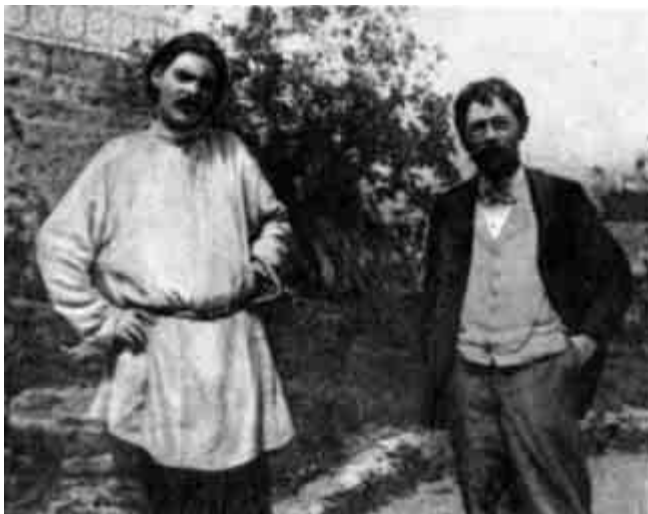
М. Горький и А. П. Чехов. 1902 г.

Хоть МХАТ отмечен Жизненной вехой, Но Горький от смущения Басит, Что, дескать, не его, А имя Чехова, Театр, по праву, Должен был носить.