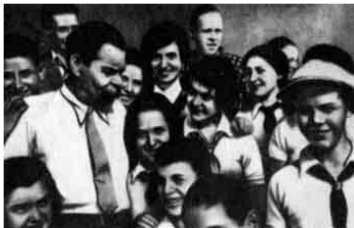
М. Горький с пионерами — авторами книги «База курных»