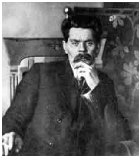
М. Горький. 1917 г.

С буржуем, что лишь злато любит, С фашистом, что забыл про честь, Иль с тем, кто в лихорадке буден, Слагает трудовую песнь?